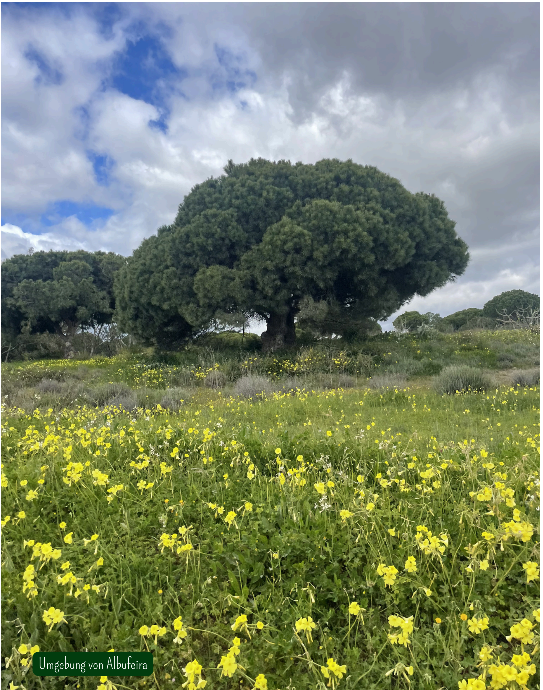
Umgebung von Albufeira