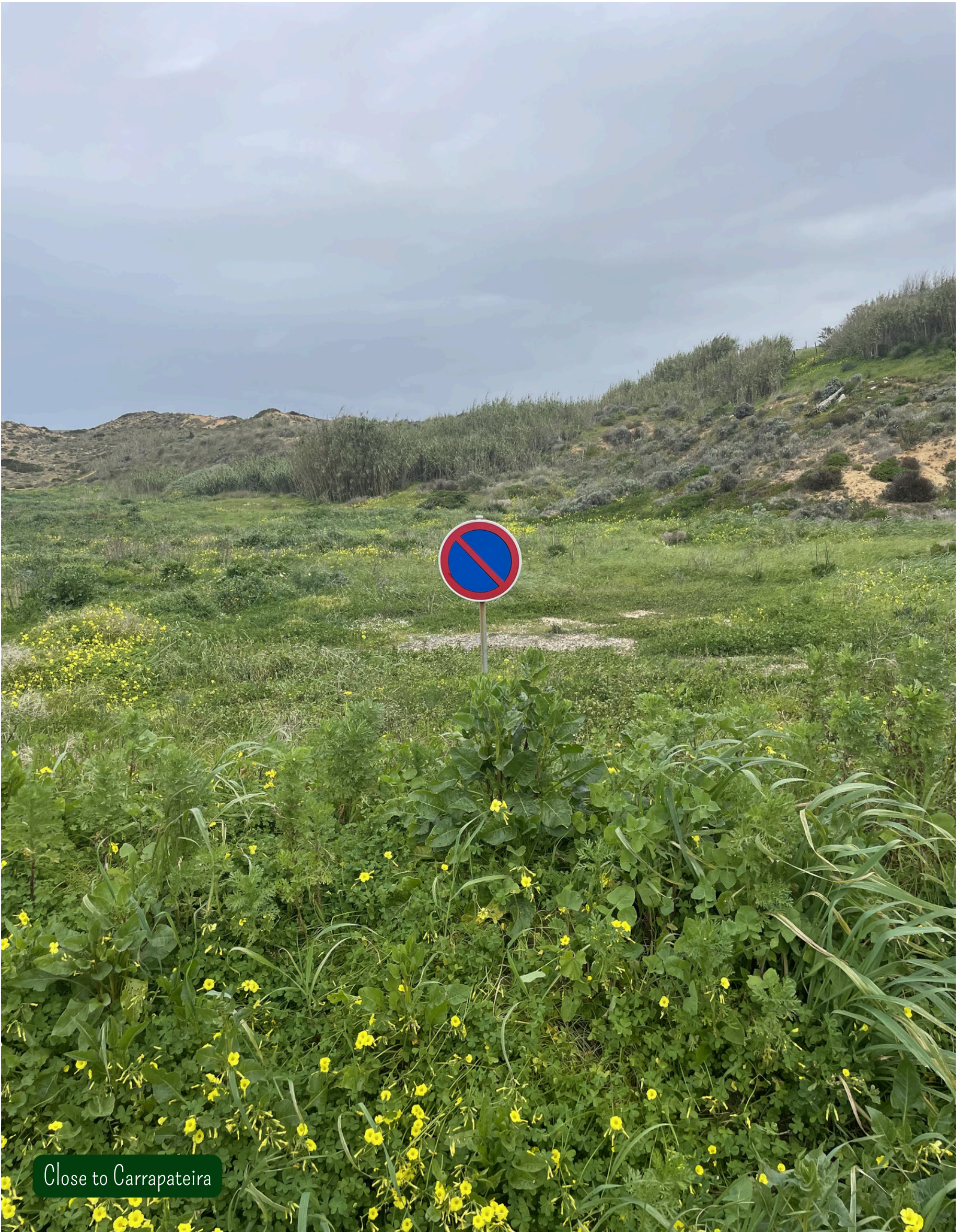
Close to Carrapateira