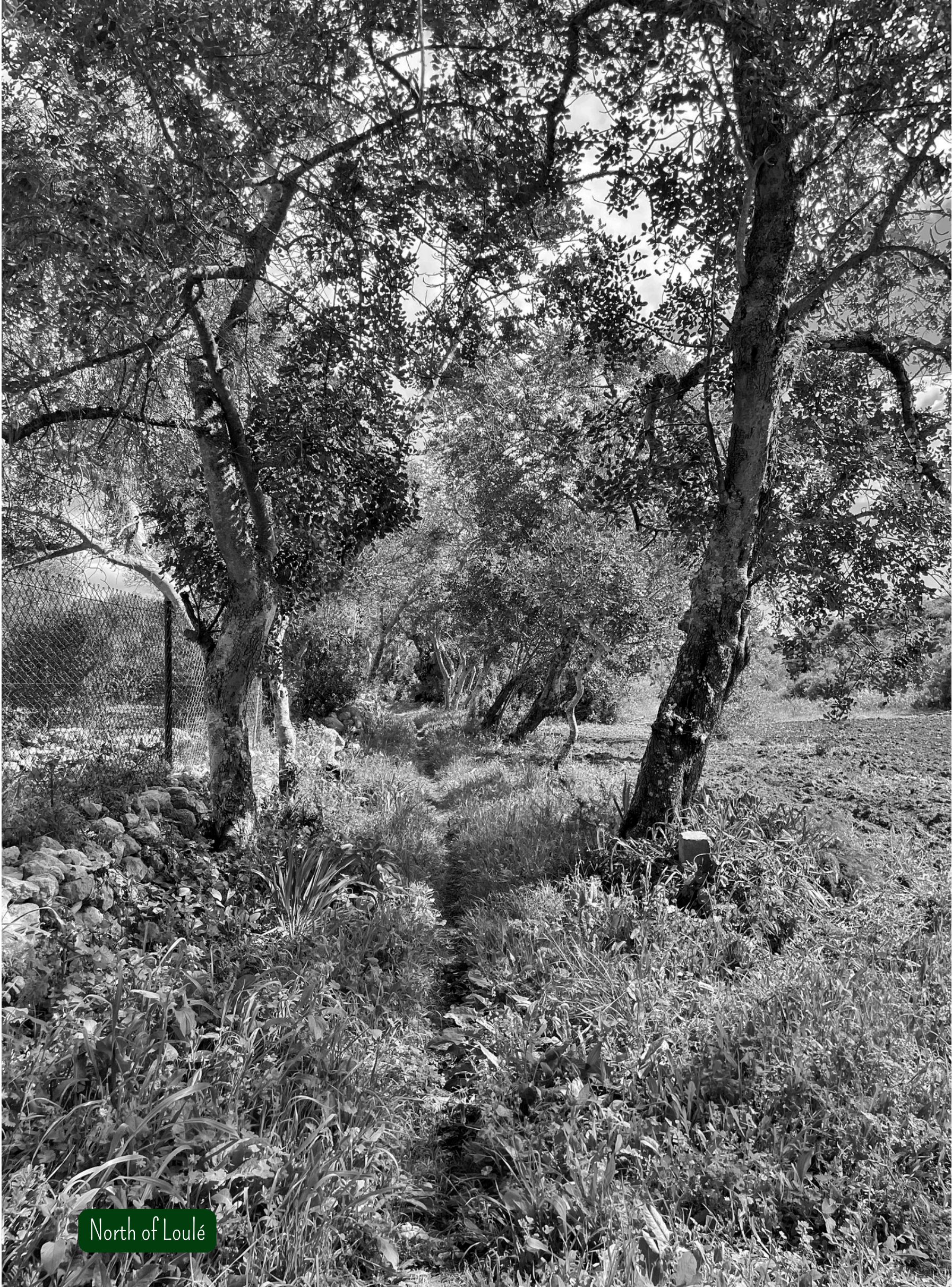
North of Loulé